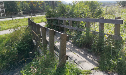
Die neue und die alte Brücke im Naherholungsgebiet